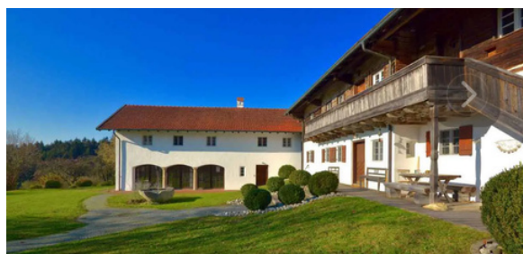
RESIDENZ - KUNSTBETRIEB BIRACH

TEILNEHMENDE WERDEN MITGLIEDER DER COMPANY ART // 2020. DAS NEU ENTWICKELTE WERK WIRD INS COMPANYPROGRAMM MIT AUFGENOMMEN UND BEI FESTIVALS UND THEATERN BEWORBEN UND AUFGEFÜHRT.